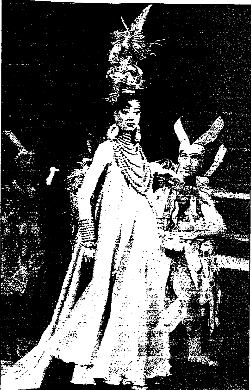
مشهد من عرض مسرحي في مهرجان بابل العراقي تظهر فيه بطة العرض في دور الاله الجمال عشتار ضمن برنامج المهرجان الذي شارك فيه فرق الموسيقى والفن من 32 دولة

دمشق - يوربي: تشواصل فعاليات شهر الثقافة اليابانية في دمشق التي تتعدت تحت عنوان «الشرق بالشرق» وتستمر حتى الخامس عشر من تشرين الأول (اكتوبر) المقبل. ويقام المهرجان بالتعاون بين وزارة الثقافة في سورية والسفارة اليابانية في دمشق وتشارك فيه هيئات مختلفة ثقافية ورياضية مختلفة. ويكون شهر الثقافة اليابانية من نشاطات رئيسية تتنوع وتتجسد مضامينها مثل حفلة موسيقية الطول الضخمة اليابانية التي يقدمها 11 عازفا من الفرقة الموسيقية اليابانية. وعرض التنسيت الزهور والاكيباناما، اضافة الى اسبوع الفيلم الياباني ويضم 6 افلام بينها فيلم الفصحى الحمراء للمخرج الياباني الشهير كاكيرا كurosawa الذي توفي مؤخرًا وهناك معرض صور عن فن العنبر اليابانية الحديثة، ومعرض رسم للفنانة يوكيو كوما، ومسافرة لسفير اليابان في دمشق تحت عنوان تطور الاقتصاد الياباني وعلاقاته مع سورية والبلدان العربية.